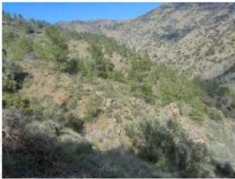
Ακίνητα 456 και 1460 με αρ. εγγραφής 0/10713 και 0/7347 αντίστοιχα: